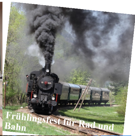
Frühlingsfest für Rad und Bahn