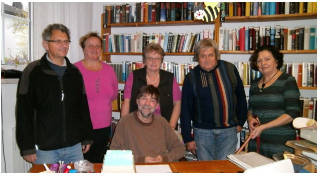
Tag der offenen Tür in der Bücherei Hohenberg