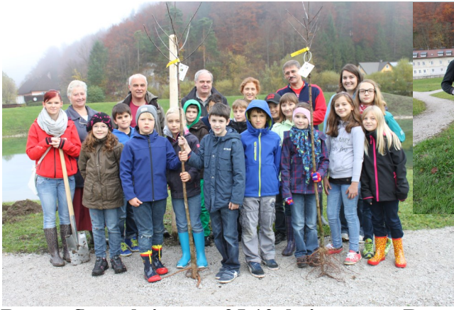
Baumpflanzaktion am 25.10. beim neuen Retentionsbecken