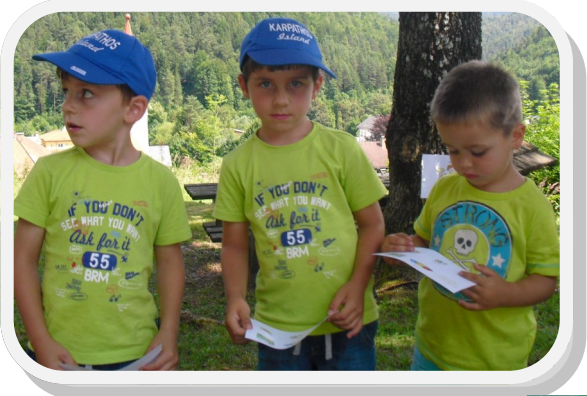
Kinderfreunde und SPÖ Hohenberg