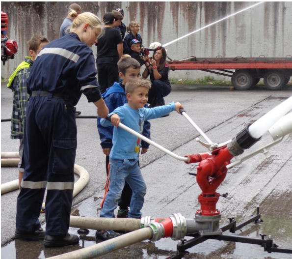
Feuerwehr, Rettung, Polizei und ÖVP Hohenberg