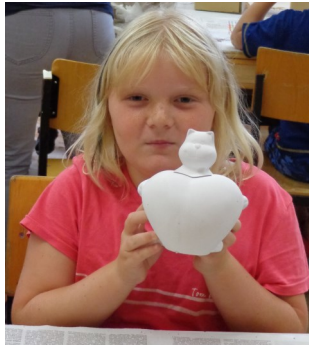
Bastel Gramm und Marktgemeinde