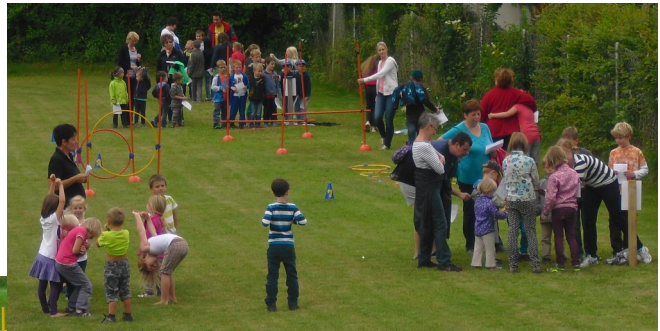
Sportunion und Seniorenbund