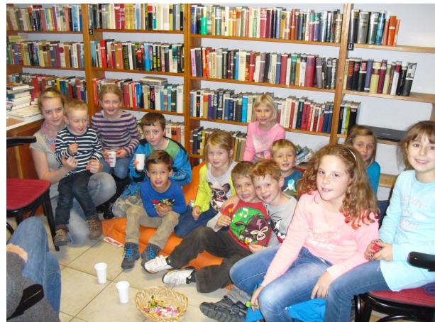
Erste Lesestunde am 7.11.2014

Jeden zweiten Freitag im Monat von 15 Uhr bis 16 Uhr in der Bücherei.