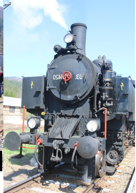
Frühlingsfest für Rad und Bahn am 19. April