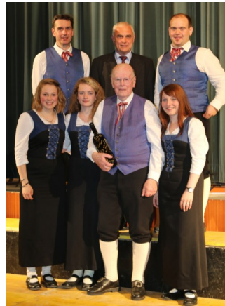
Frühlingskonzert des MV Hohenberg