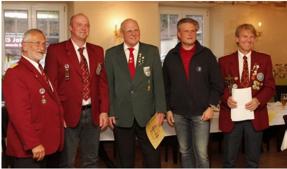
25 Jahre Schützenverein Schusterwirt