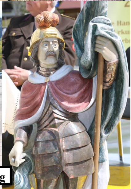
140 - Jahr - Feier Freiwillige Feuerwehr Hohenberg