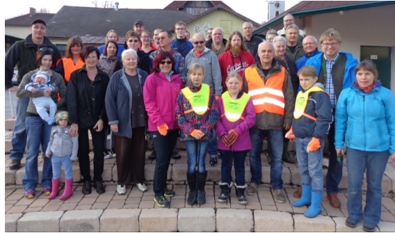
Ortsreinigung– Danke an alle Helfer!