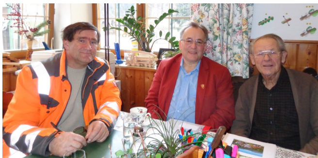
Holzbestellung bei der Fa. Brunner-Stern für Hochbeete zum Projekt „à Fleckerlparadies“