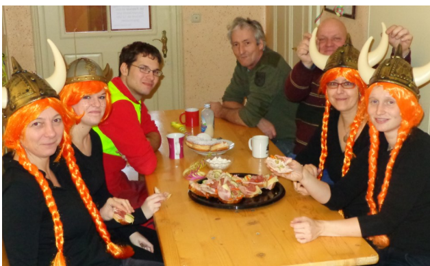
Faschingsdienstag in Hohenberg