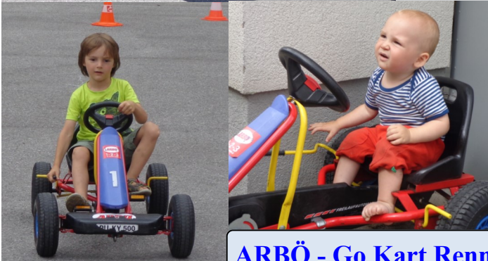
ARBÖ - Go Kart Rennen