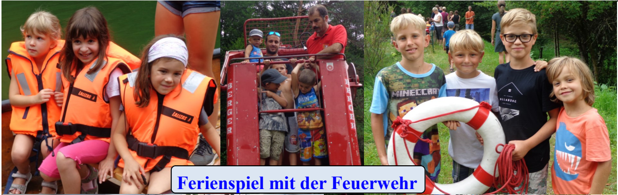
Ferienspiel mit der Feuerwehr