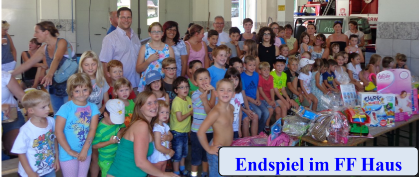
Endspiel im FF Haus

Herzlichen Dank bei allen Veranstaltern, Vereinen, Sponsoren und freiwilligen Helfern