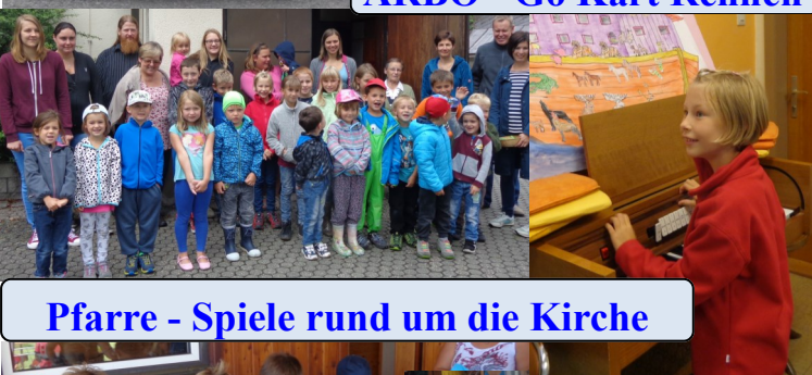
Pfarrre - Spiele rund um die Kirche