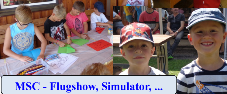
MSC - Flugshow, Simulator, ...