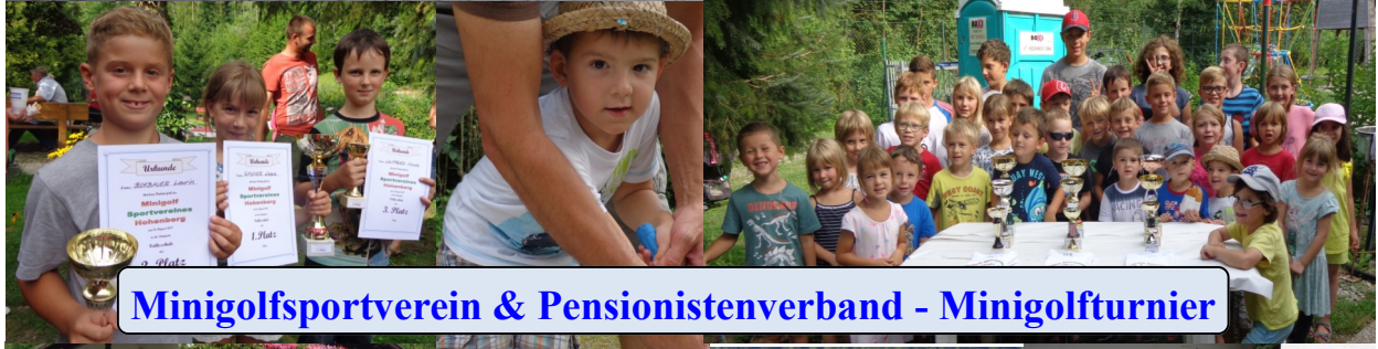
Minigolfsportverein & Pensionistenverband - Minigolfturnier