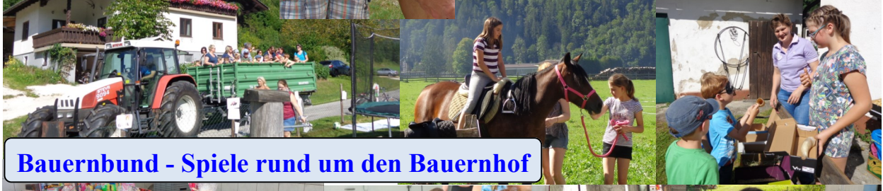
Bauernbund - Spiele rund um den Bauernhof