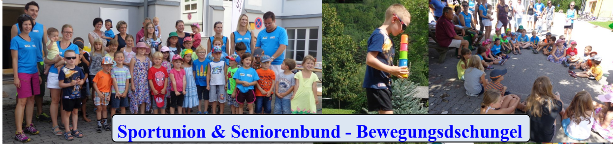
Sportunion & Seniorenbund - Bewegungsdschungel