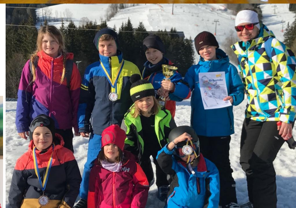
Bezirksschülerschitag: Bei herrlichem Wetter fanden am 28. Februar die alljährlichen Bezirksmeisterschaften im Ski alpin in Annaberg statt.