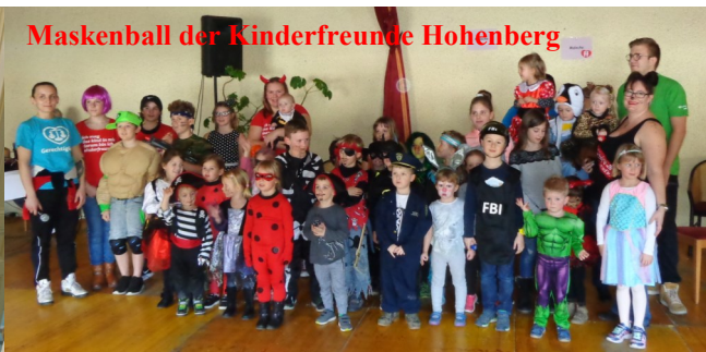
Maskenball der Kinderfreunde Hohenberg