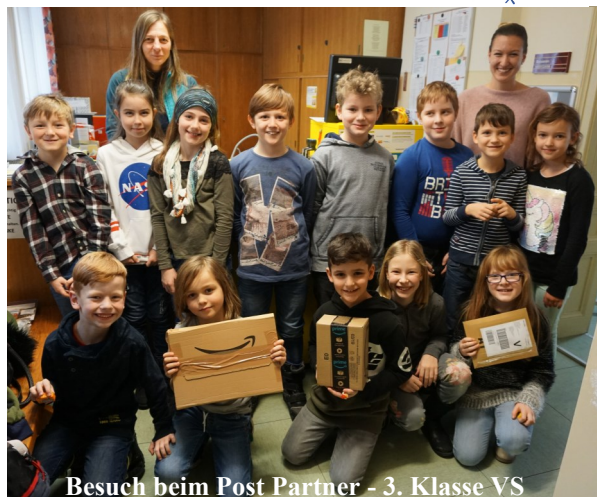
Besuch beim Post Partner - 3. Klasse VS